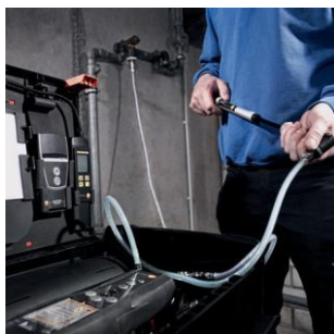
Prova di carico

* Strumento, pompa, tubetti di connessione, con valvola per sovrappressione e rubinetto d'arresto