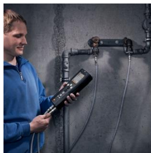
Prova di idoneità all'uso