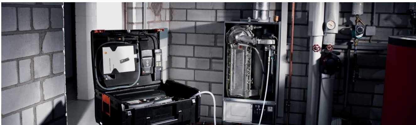
Controllo automatico della capacità operativa con serbatoio di riempimento gas collegato alla caldaia a gas