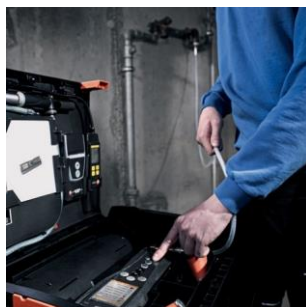
Controllo automatico della tenuta